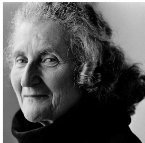
Abbildung 3, Fotocredit: Walter Schels, Hamburg

Hier gibt es nähere Informationen zum Programm und weitere Infos: