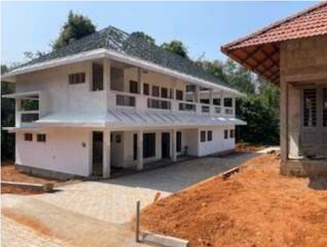
Gemeinschaftshaus im neuen Dorf