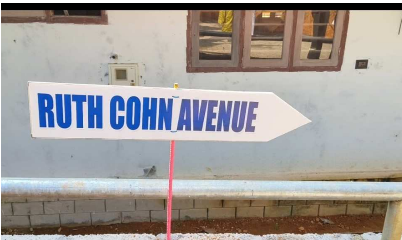
Bitte hier entlang.