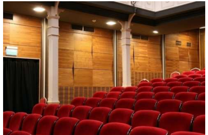
Kinosaal

In der Völklinger Hütte, Weltkulturerbe, ist die viel gelobte Filmausstellung des deutschen Films von 1895 bis heute zu besichtigen. Wir wollen euch einladen, gemeinsam den Blick in die Zeit zu richten, in der Ruth Cohn in Berlin aufgewachsen ist. Filmausschnitte dieser frühen Zeit ermöglichen uns eine Annäherung an ihr Erleben. Ebenso die Zeit ihrer Rückkehr nach Europa, die viele von uns schon bewusst wahrgenommen haben. Filmausschnitte aus „Berlin. Symphonie der Großstadt“ von 1927 oder „Hitlerjunge Quex“ 1933, hin zu „Angst essen Seele auf“ von 1974, dem Jahr von Ruth Cohns Rückkehr nach Europa. Die zeitliche Einengung auf zwei Epochen ist eine Möglichkeit, sich der Ausstellung zu nähern.