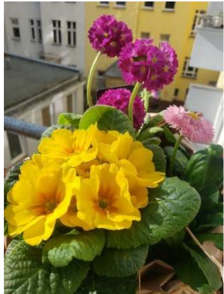
Grüße von Balkonien.

Herzliche Grüße aus Berlin Kathrin Giogoli und Jasmin Lütz