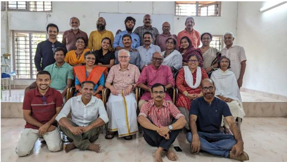
Workshop an der Mahatma Gandhi Universität

Veranstaltungsort war das Direktorat für angewandte Kurzzeitprogramme (DASP) der Mahatma Gandhi Universität, Kottayam. Der internationale TZI-Workshop umfasste 18 Sitzungen vom 12. bis 15. Januar 2024.