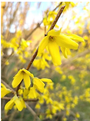
Frühling