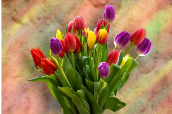
Bunte Tulpen zum Ehrentag.

Wir wünschen Ihnen Gesundheit und alles Gute! 🎁 🌸