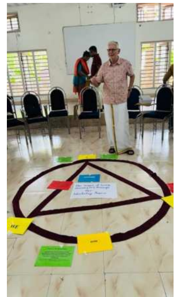
Workshop in Kerala, Fotocredit: RCI India

Um zu zeigen, dass wir alle einbeziehen, stellte Matthias einen freien Stuhl ins Plenum und nannte ihn "Der Andere", der während des gesamten Workshops dort stand.