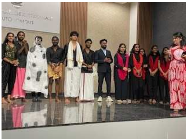
Studententag mit Dozent:innen und Studierenden am Marian College «Theme-Centered Interaction (TCI) as a Pedagogic Approach for Holistic Learning in Higher Education, Fotocredit RCI India