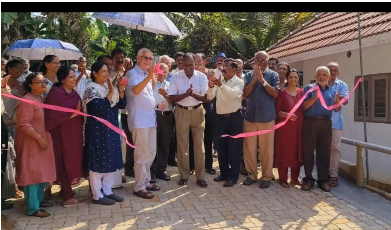
Applaus für die Ruth Cohn Avenue bei der Einweihung am 23. Januar 2024.