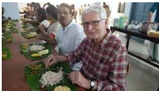
Gemeinsames Mittagspause mit leckerem indischem Essen, Fotocredit RCI India