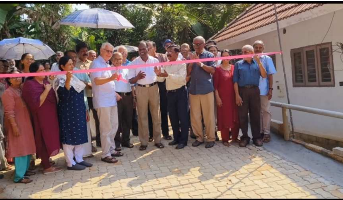
Feierliche Einweihung der Ruth Cohn Avenue