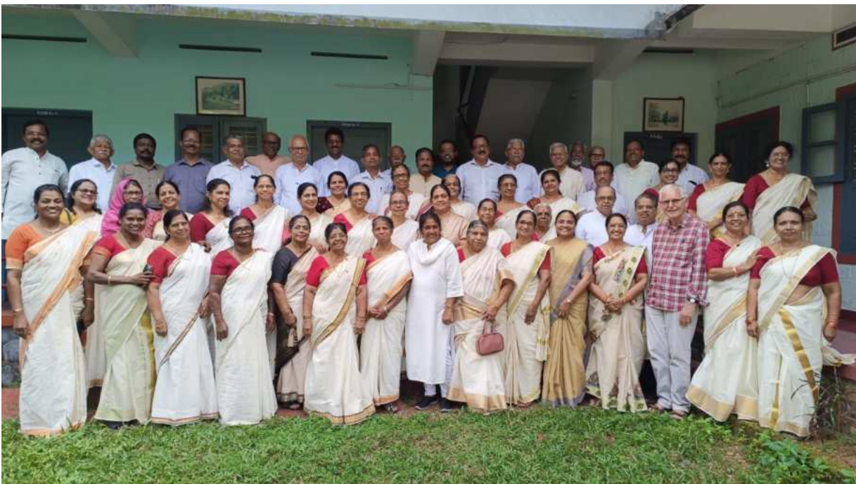
Synergy TCI Forum for Senior Citizens, Fotocredit: RCI India