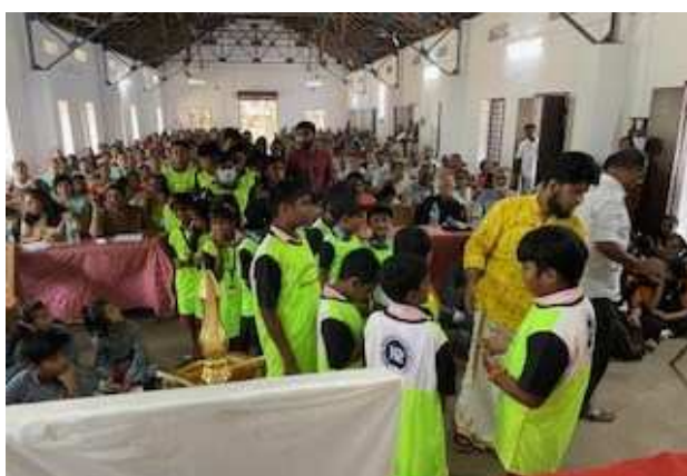
Fest im Butterfly Village