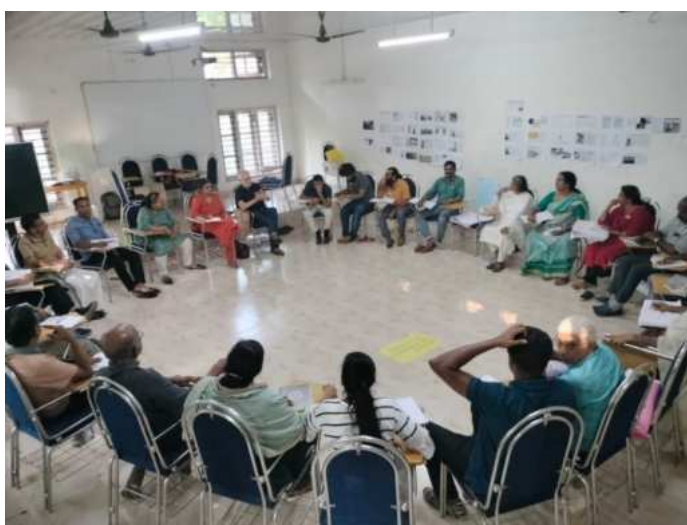
Workshop und interreligiöses Treffen zu »All-Connected into a Planetary Future"